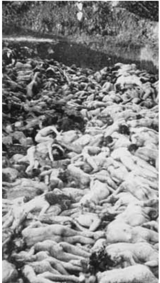
Stepan Bandera ukrainarraren erakundeak (OUN) 100.000 poloniar eta judu hil zuen II. Mundu Gerran. Argazkian, Ukrainako hobi komun bat.

Europar Batasunak hasiera-hasieratik, 2014tik aletia, Zelenskiren politika babesteko erabakia hartu zuen eta horretan segitzen du gaur ere. Inoiz armada batek bere esku eduki ez dituen obus, blindatu, tanke, hegazkin, aholkulari, aditu, ikastaro eta gainerako arma kopurua ematen ari gatzazkio etengabe Zelenski asezinari Europar Batasunetik. Eta gainerako gastuetarako, hemengo herritarren bizimodua hobetzeko beharrezkoak diren ehunka mila euro ere. Bitartean, ze politika ari da egiten presidente hau hain laguntza erraldoiren truke? Lehenik, aipatua dugun Donbassko genozidioa azpimarratu beharko dugu berriz ere. Genozidioa delako Gobernuak Ukrainaren ekialdea gupidarik gabe behin eta berriz bonbardatzea, bertako herritarren heriotza nahita bila-