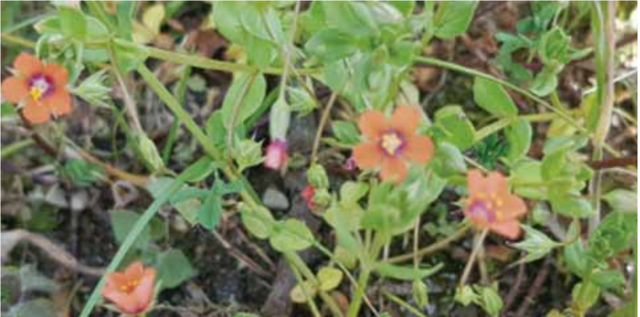
Pasmo belarra Lysimachia arvensis

Gozatu ederra hartu giñenen orduko hartan, Garbiñeren hitz jarioarekin.