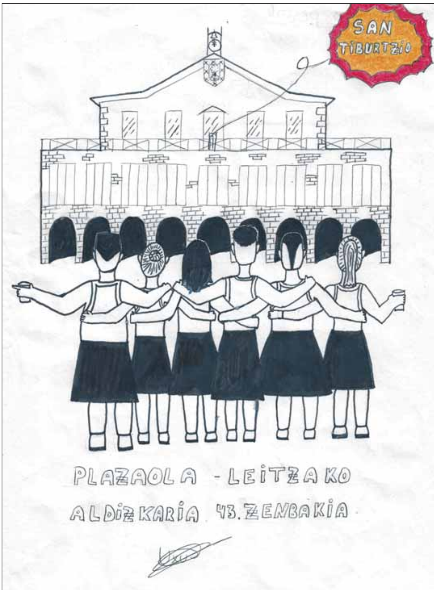
"LEITZEKO PESTAK" UXUE AGIRRE CABALLERO -ren lana izan da 16 urtetik beherakoen artean irabazlea ZORIONAK