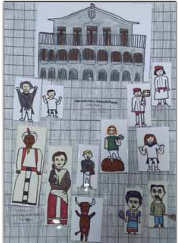
“126 ORDUAK DISFRUTATZERA” LIHER ARIZTIMUÑO ZUBELDIA