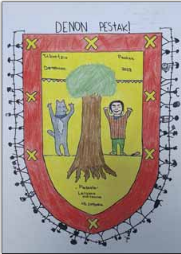
“DENON PESTAK!” LIHER ARIZTIMUÑO ZUBELDIA