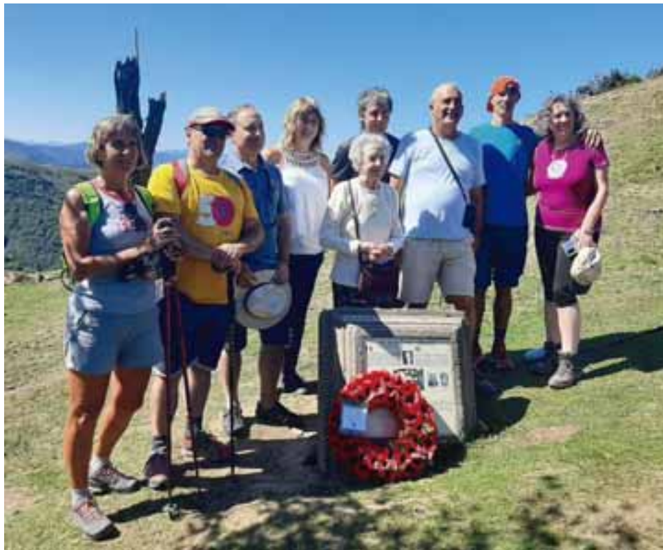
Comèteko mugalarien omenezko monolitoa. Mihuratarrak, agintariak, Comèteko partaideak eta hegazkin-pilotuen ondorengoak.

zuten. Bilbotik Gibraltarrera, ondoren Londresa joateko. Zenbait kasutan, hiru hilabete igarotzen ziren hegazkinean erori zirenetik etxera itzuli arte.