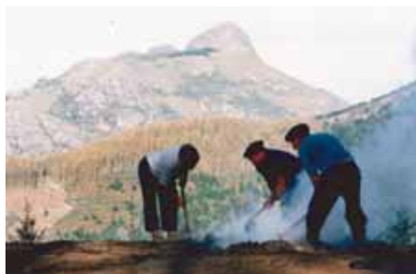
“Oartzunen, Batixta Perurenarekin”.