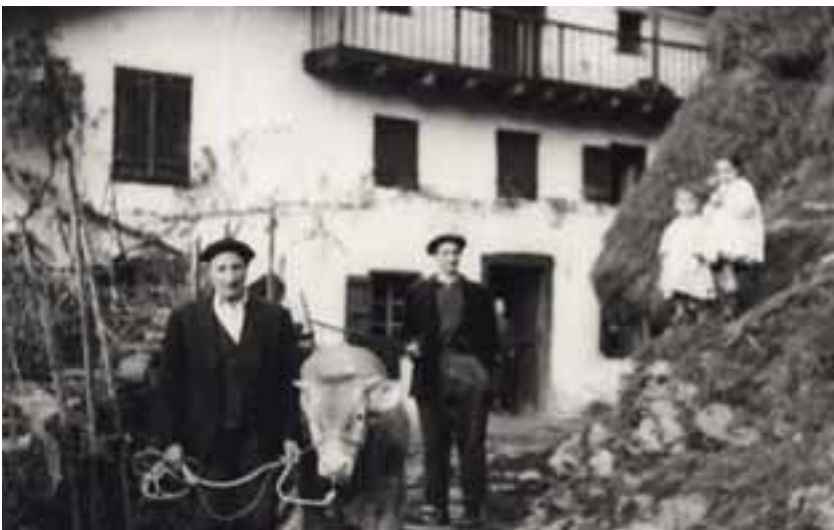
Jauregikoborda.