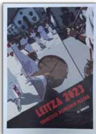
"BETIKO DOINUAK" AXUN ARRIBILLAGA GAZTAÑAGA